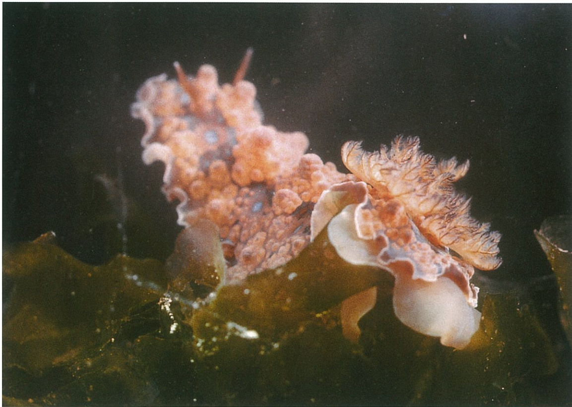
能登半島九十九湾に生息するミヤコウミウシ ( Dendrodoris denisoni )

Annual Report of Noto Marine Laboratory Institute of Nature and Environmental Technology, Kanazawa University